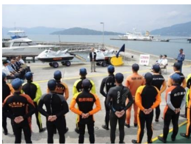
寄贈式には、消防職員特別教育水難救助科の学生18名も参加