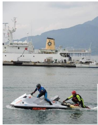
救助デモンストレーション